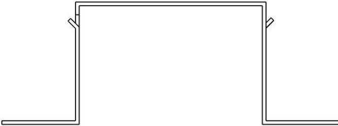
【使用状態を示す参考図】